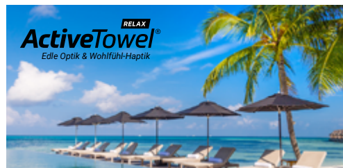
Ansicht des fertigen ActiveTowel® Relax